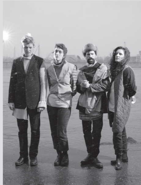
Endless Wellness © Rea von Vić