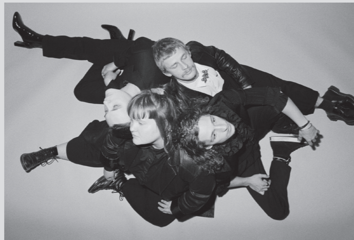
Bipolar Feminin © Apollonia Theresa Bitzan