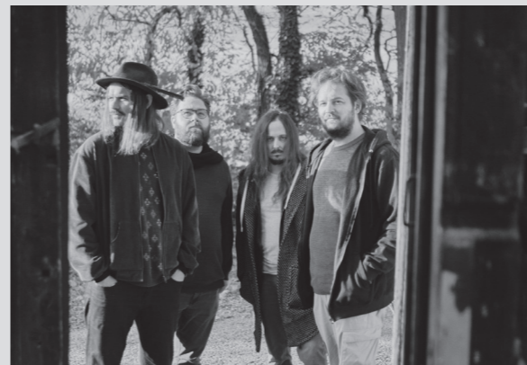
Gravögl © Markus Marouschek

IMPRESSUM / Medieninhaber (Verleger): NÖ Kulturlandeshauptstadt St. Pölten GmbH Ludwig-Stöhr-Straße 7; 3100 St. Pölten, Österreich / Für den Inhalt verantwortlich: Tarun Kade, Stefan Mitterer, Angelika Schopper / Design: DOUBLE STANDARDS / Gestaltung: Buero TMG / Foto (innen): Peter Rauchecker / Stand: Juni 2024 / Terminänderungen bleiben vorbehalten. Für Druck- und Satzfehler wird keine Haftung übernommen. / Hersteller, Herstellungs- und Erscheinungsort: Riedeldruck, Druck Fulfillment-Druck Service GmbH, Bockfließstraße 60-62, 2214 Auersthal